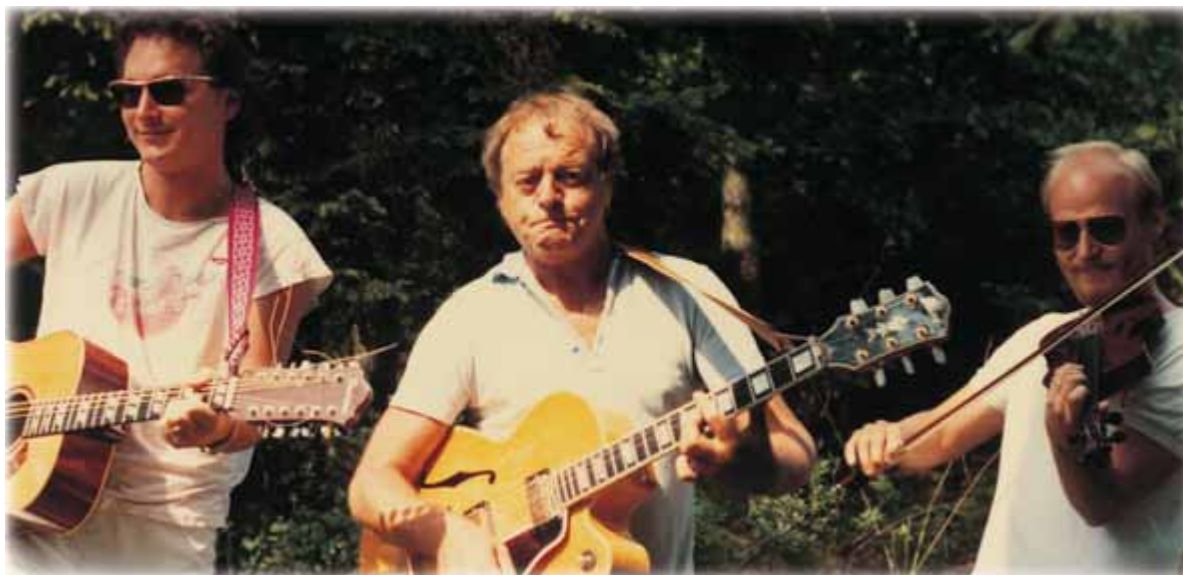
Midsommarfrände på Viggso